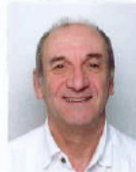
PONTCHARTRAIN CHENNEVIERES LA RICHARDERIE