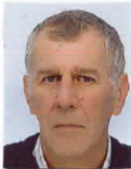
JOUARS LES MOUSSEAUX