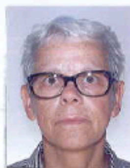
PONTCHARTRAIN LA DAUBERIE